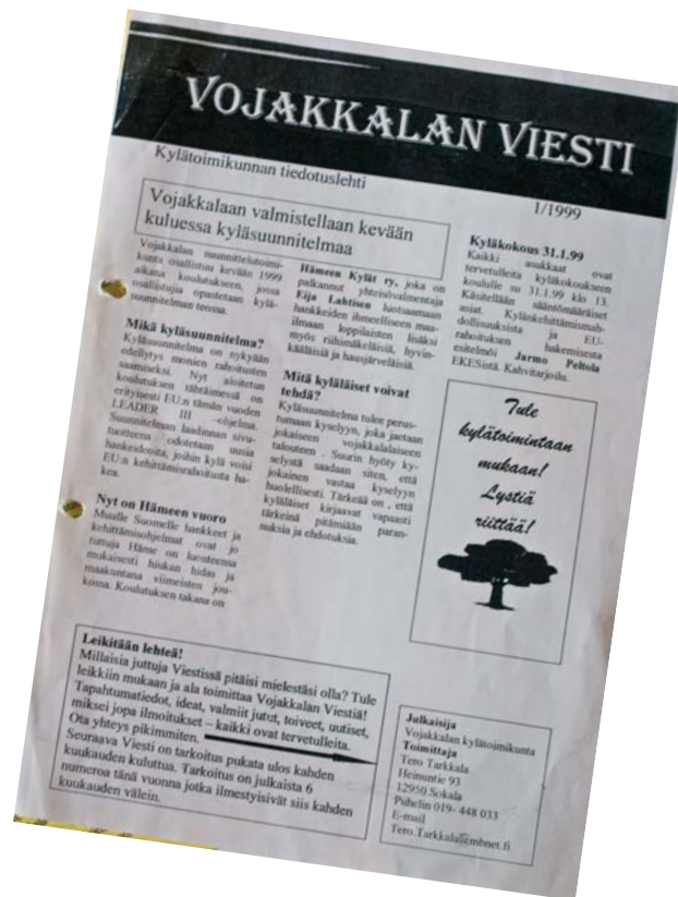
Tästä kaikki alkoi - Vojakkalan Viestin ensimmäinen numero vuodelta 1999.

Vuosien varrella ihmiset alkoivat jo suorastaan odottaa Viestin ilmestymistä. Monet tutut kyselivät kylällä minulta Viestin ilmestymisestä. Viestistä tuli myös kesäasukkaiden keskuudessa menestys heti ensimmäisellä kertaa, kun sen kesän numero jaeltiin jokaiseen postilaatikkoon Vojakkalassa. Seuraavana vuonna kesäasukkaatkin jo kuulemma kyselivät kylä-