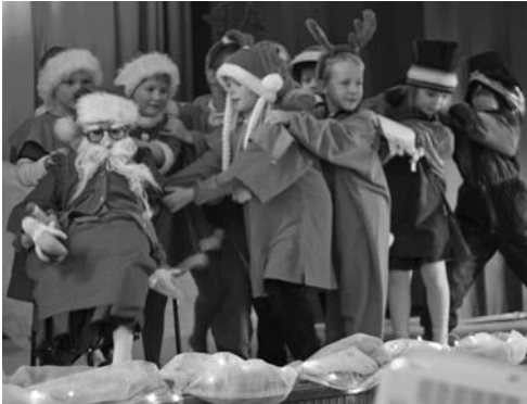
Joulun alla Topenon seuratalo täyttyi yleisöstä, kun vietettiin koulun tunnelmallista joulujuhlaa. Hienot oli esitykset!

Länsi-Lopen koulun ulkovarastoon Topenolle voi jättää keräyspaperia pitkin vuotta, mieluummin niputettuna tai säkitettynä, että järjestys säilyy.