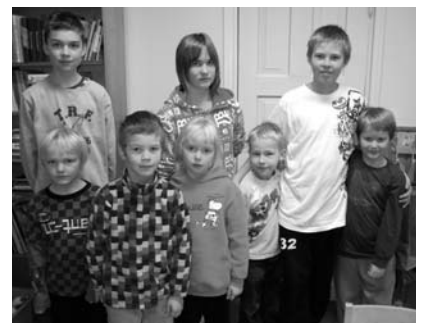
Kutoset ovat auttaneet eskareita tietokoneen käytön opettelussa syyslukukauden aikana. Kuvassa eskarit kummeineen (6. lk).